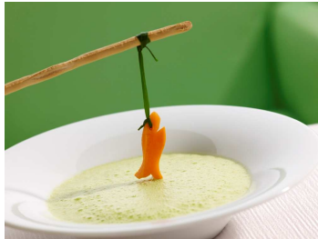
[m]eatery bar + restaurant Silvestermenü für Kinder: Grünes Erbsensüppchen mit Karotte

Für kleine Feinschmecker bis zwölf Jahre hat das Team der [m]eatery bar + restaurant ein eigenes Silvester Menü zusammengestellt: Gestartet wird mit einem Glückspilz, gefolgt von einem grünen Erbsensüppchen mit Karotte. Der dritte Gang, Tigerentenravioli, orientiert sich farblich an der beliebten Kinderfigur. Zum Nachtisch gibt es für die Kids den Eis-Klassiker Coupe Danmark. Der Preis für das kleine Feinschmecker Menü beträgt 39,00 Euro exkl. Getränke.