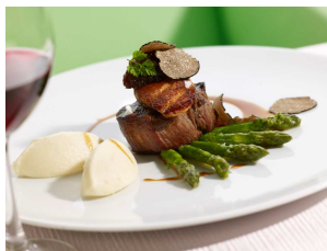
[m]eatery bar + restaurant Silvestermenü: Rinderfilet Rossini

Für alle Genießer und Feierfreunde haben SIDE und [m]eatery bar + restaurant wieder eine perfekte Kombination aus Genuss und Party für die Silvesternacht zusammengestellt: Ab 19:00 Uhr starten die Gäste in der [m]eatery bar + restaurant mit einem Glas Champagner in die letzte Nacht des Jahres. Das exklusive Sechs-Gänge-Menü beginnt mit einem Avocado Hummertörtchen mit Parmesan-Eis. Es folgt weißer Heilbutt mit Erbsenravioli und Artischocken Brandade. Das anschließende Grand Design Sorbet ist nicht nur lecker, sondern sorgt auch für weiteren Appetit. Beim vierten Gang muss eine Entscheidung her: Zartes Rinderfilet Rossini mit schwarzem Trüffel und Gänseleber oder pochierte, gegrillte Rotbarbe mit Safranrisotto und Minze.